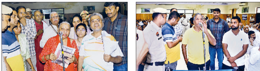
रोहतक। परिवेदना समिति की बैठक के दौरान अपनी शिकायतें सुनाते फरियादी।