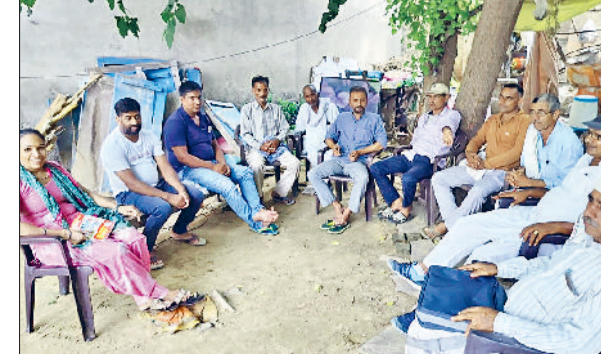
रोहताक। मीटिंग करते भवन निर्माण कामगार यूनियन हरियाणा (सीटू) के सदस्य।