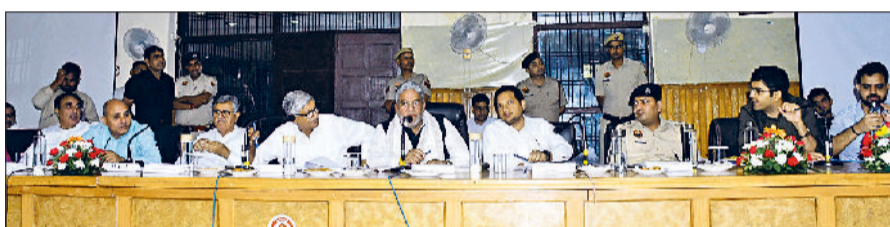
रोहतक। परिवेदना समिति की मासिक बैठक में समस्याओं का समाधान करवाते खनन मंत्री कृष्ण लाल पंवार।

बैठक के दौरान दूसरी महिला की फरियाद थी कि गत 19 जुलाई को नगर निगम ने मेरे पारस नगर स्थित घर के सामने बने चबूतरों को बिना नोटिस के तोड़ दिया। इस शिकायत पर कार्रवाई करते हुए मंत्री ने एसडीएम को जांच करने के आदेश दिए। बता दें कि बैठक में कुल 20 शिकायतें रखी थीं। इनमें से 11 का हल मौके पर कर दिया गया। जबकि 9 पर अगली मीटिंग में विचार-विमर्श करने का निर्णय लिया गया है।