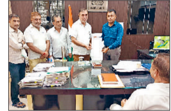
हरिभूमि न्यूज मंम

हरियाणा रोडवेज और सहकारी समितियों की कई बसें महम में बाईपास से होकर गुजर रही हैं। इससे यात्रियों को परेशानी का सामना करना पड़ रहा है।