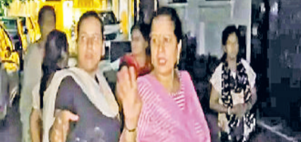
विधायक के घर के बाहर विरोध प्रकट करती महिलाएं।

मोहल्ले में पिछले काफी समय से कहीं पानी ही नहीं तो कहीं दूषित पानी मिल रहा। महिलाओं का कहना है कि लंबे समय से उन्हें पीने के पानी की भारी दिक्कत झेलनी पड़ रही है।